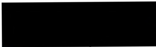
zhotovitel Jiří Mittelbach KVS stavební, s.r.o. („Správce“)