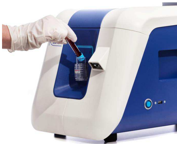
Uzavřený systém dávkování vzorku