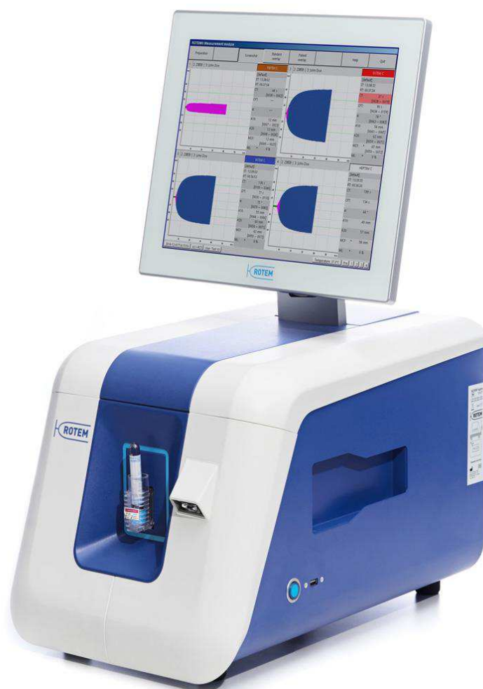
Tromboelastometr ROTEM® sigma

ROTEM® sigma je první analyzátor, který plně zautomatizoval vyšetření při zachování ověřeného detekčního principu metody tromboelastografie resp. tromboelastometrie* (měří se viskoelastická krev mezi stěnami, ke kterým je navzájem v pohybu - imitace proudění krve in vivo ). Díky kompaktní konstrukci a plné automatizaci vyšetření jsou minimalizovány nároky na obsluhu a přístroj je ideální pro použití „bed-side“ (resp. POCT ).