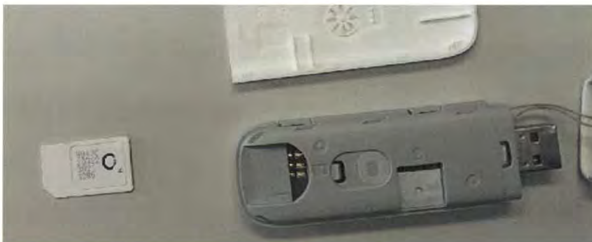
Obrázek 1 - Fotografie předaných SIM

SIM byly předány osobně dle pokynů zadavatele.