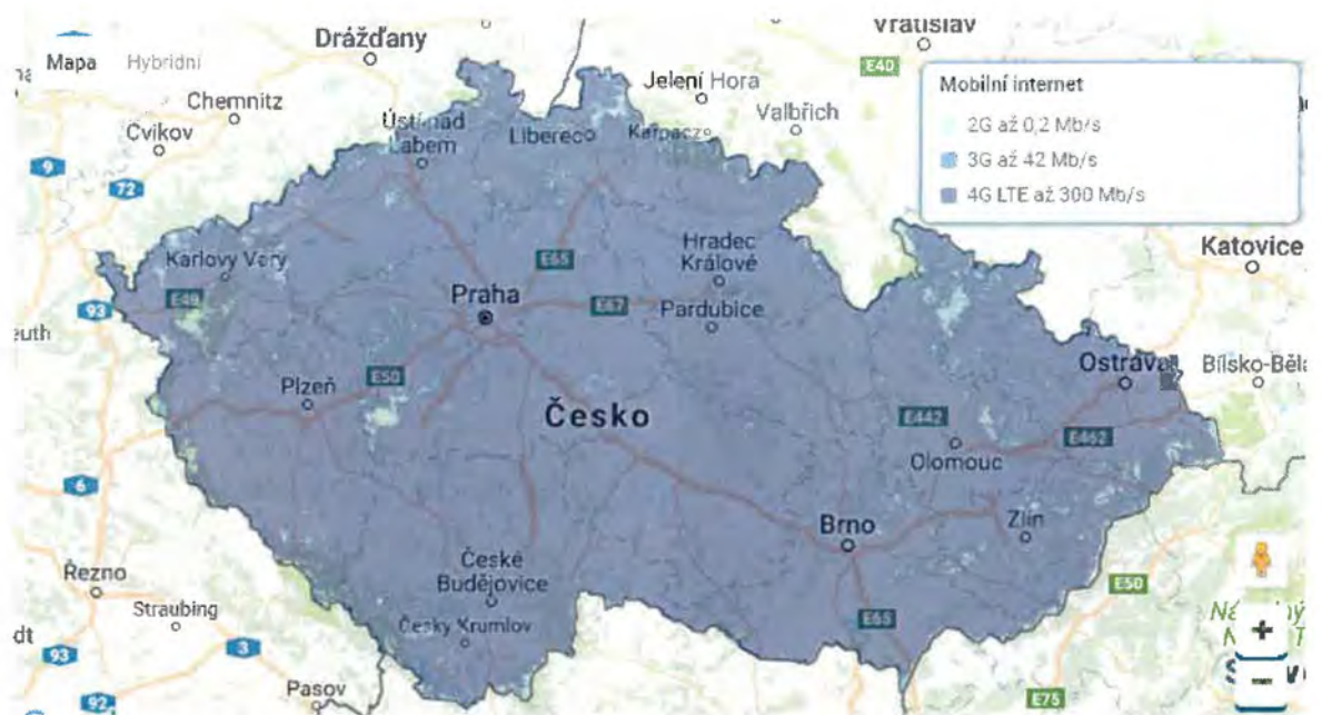
Obrázek 3 - Mapa pokrytí území ČR signálem pro Mobilní internet