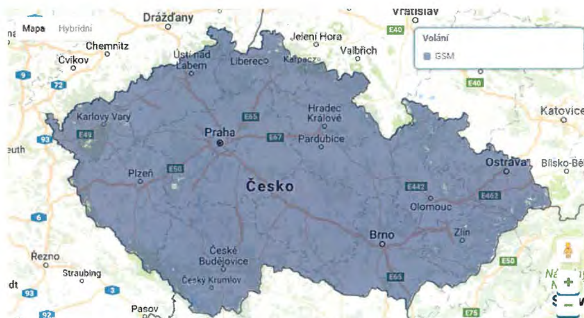
Obrázek 2 - Mapa pokrytí území ČR signálem pro hlasové služby