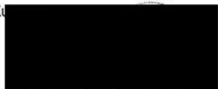
Za Olomoucký kraj Ladislav Okleštěk hejtman Olomouckého kraje