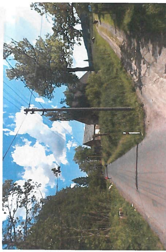
Silnice III/27810 Šimonovice, rekonstrukce silnice