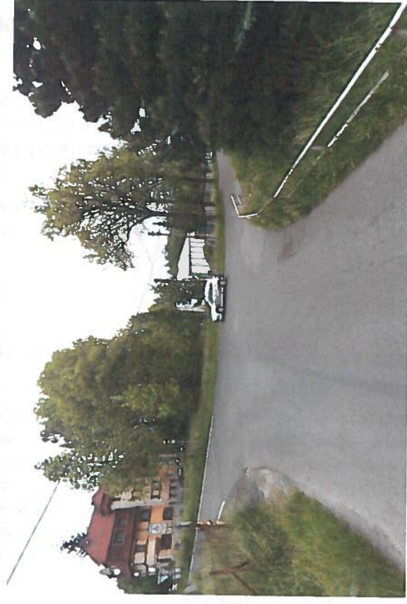
Silnice III/27810 Šimonovice, rekonstrukce silnice