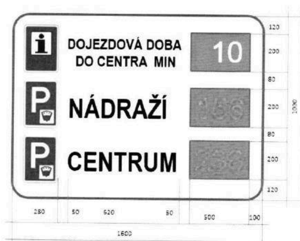
Obrázek 1- Požadované provedení zařízení pro provozní informace