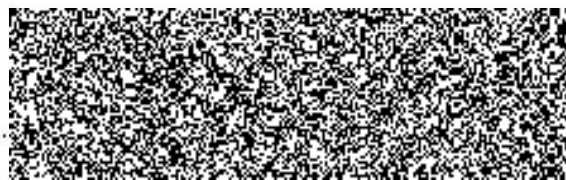
..... náměstek ředitele krajského ředitelství pro ekonomiku