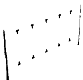
herní prvek lanový, typ č. 1