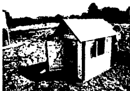
domeček pro děti