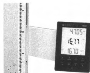
Multifunkční dotykový displej

Všestranná a stabilní měřicí stanice seca 285 je vhodná pro použití u dětí i obézních pacientů do 300 kg. Výškový rozsah měřicí stanice je od 30 do 220 cm. Po zadání dílčích parametrů (pohlaví, věk a úroveň fyzické aktivity – PAL), seca 285 umožňuje určit i celkovou spotřebu energie pacienta. Určena pro lékařské využití. Automaticky vypočítá BMI a zobrazí hodnotu na multifunkčním dotykovém displeji. Medicínsky ověřená váha s označením M a třídou přesnosti III.