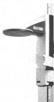
Výškoměr s integrovanou Frankfurtskou linií