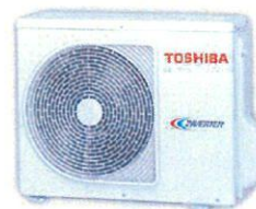
RAS-xx PAVSG-E (R32) RAS-xx N3AV2-E1 (R410A)