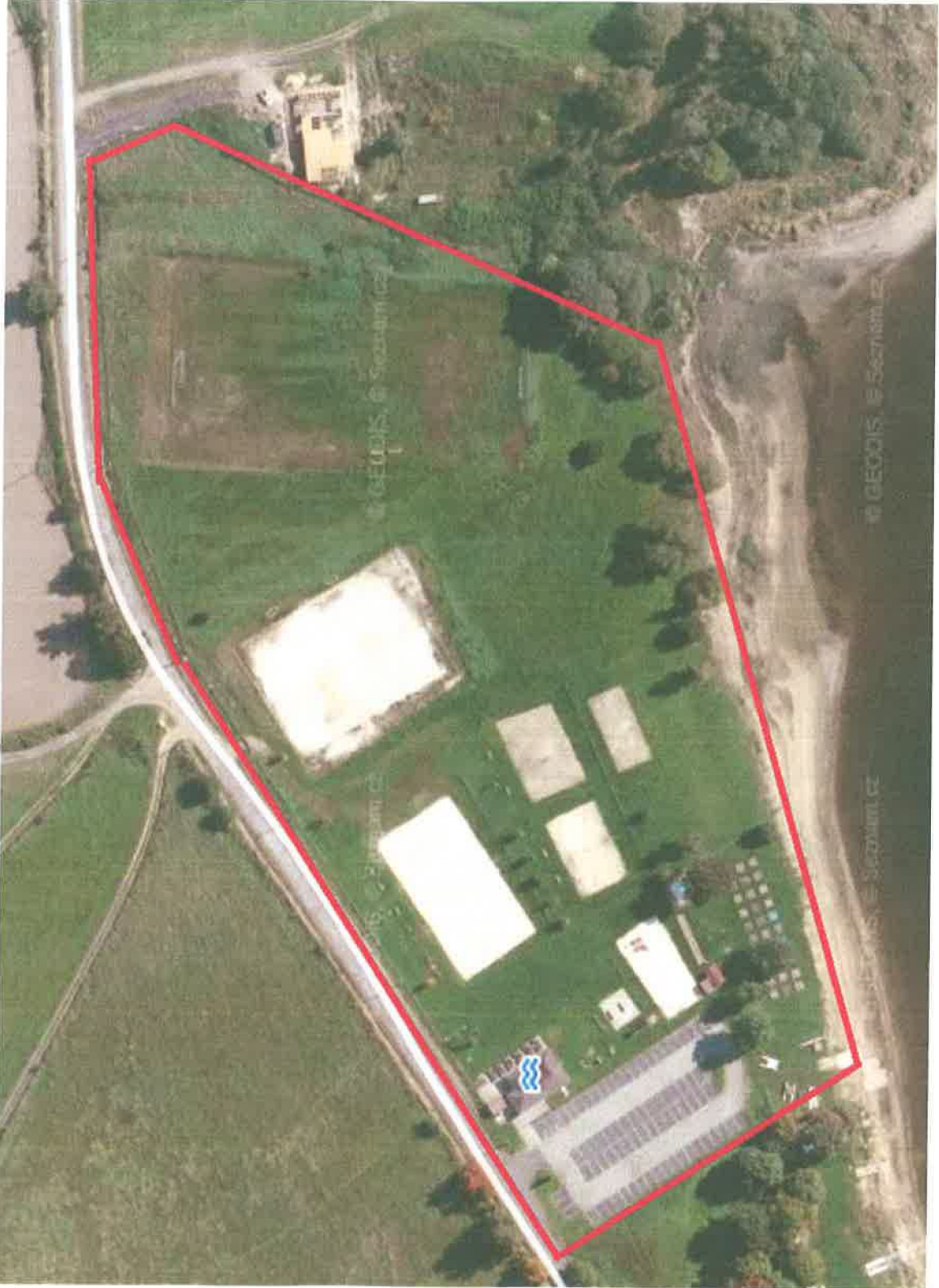
Příloha č. 3 - Přehledná situace předmětu pachtu