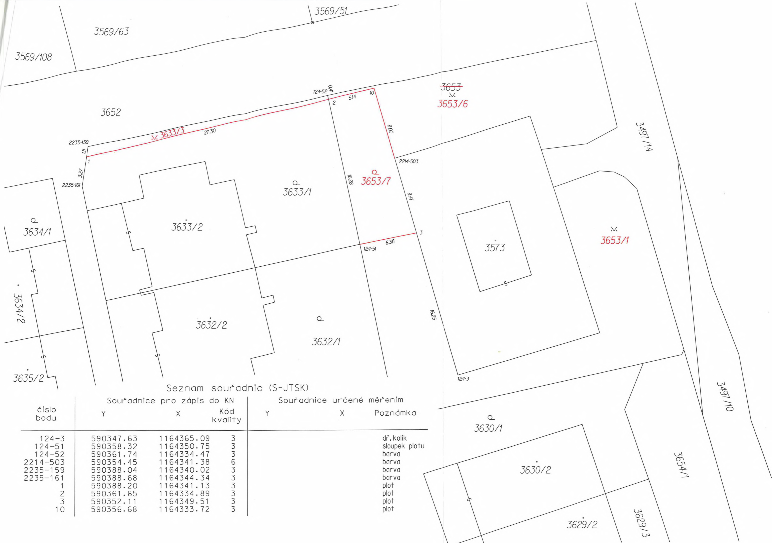
Seznam souřadnic (S-JTSK)