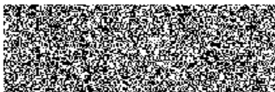
ředitel divize 9, na základě plné moci Metrostav a.s.