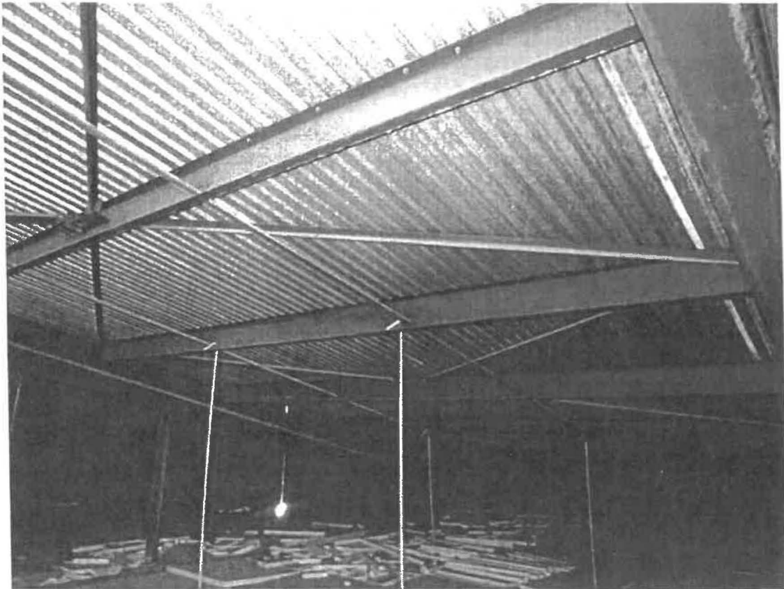
Obr. č. 2 zachycující systém nosných ocelových rámu a vaznic (paždíků)

Stávající střešní krytina je kotvena do ocelových vaznic, kterou jsou ovšem tvořeny tenkým válcovaným U profilem. U profil je kotvený do svařovaných nosných rámu šroubovými spoji. Konstrukce nedovoluje osazení vzt jednotek a dodatečné ztužení v příčném směru, kvůli absenci středové vaznice.