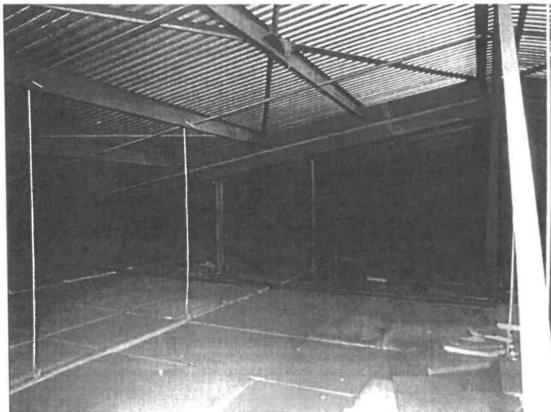
Obr. č.1 zachycující systém zavěšení podhledu

Dále bylo zjištěno, že objekt postrádá příčné ztužení, které by bylo zapotřebí při přitížení konstrukce od účinků větru, v případě, že by se instalovaly nástřešních vzduchotechnické jednotky.