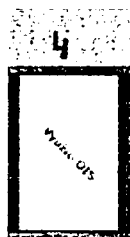
Předmět výpůjčky - Vitrína č. 4