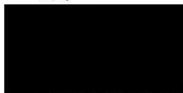
ředitel HZS Jihočeského kraje

V Českých Budějovicích dne 12 -07- 2018 Za příjemce: