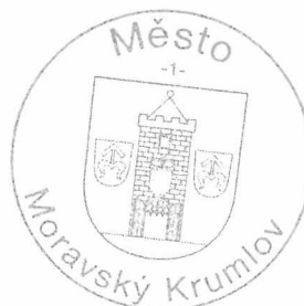
Mgr. Tomáš Třetina starosta města