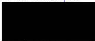
Alena Pokorná prodávající