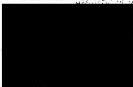
vedoucí Odboru investičního Magistrát města Brna