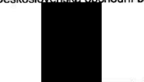
Oldřich Voltr Specialista pro provozní podporu