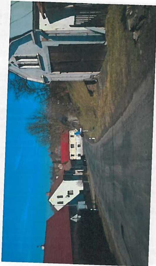
Silnice II/263 Valteřice – Horní Police, rekonstrukce silnice