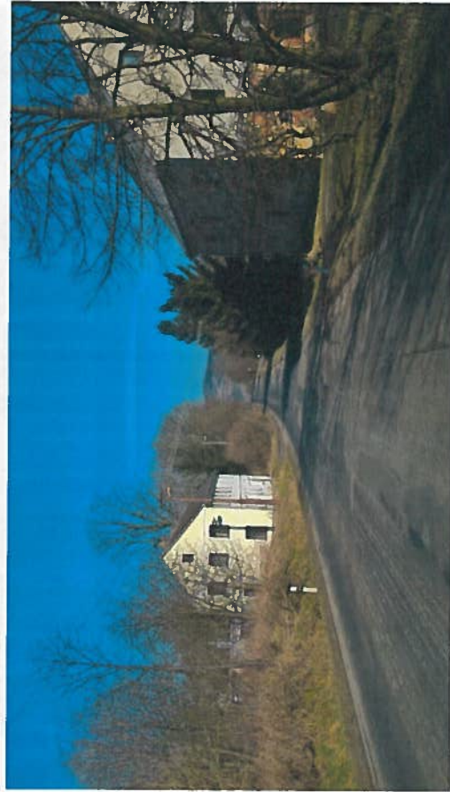
Silnice II/263 Valteřice – Horní Police, rekonstrukce silnice