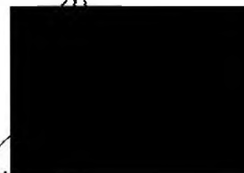
Ing. Bedřich Čížinský jednatel IDEA s.r.o.

IDEA s.r.o. Benediktská 9 110 00 Praha 1 IČO: 60490322, DIČ: CZ60490322