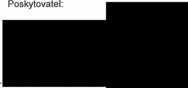
Ing. Vladislav Vilímeč náměstek hejtmána Plzeňského kraje pro oblast kultury a památkové péče