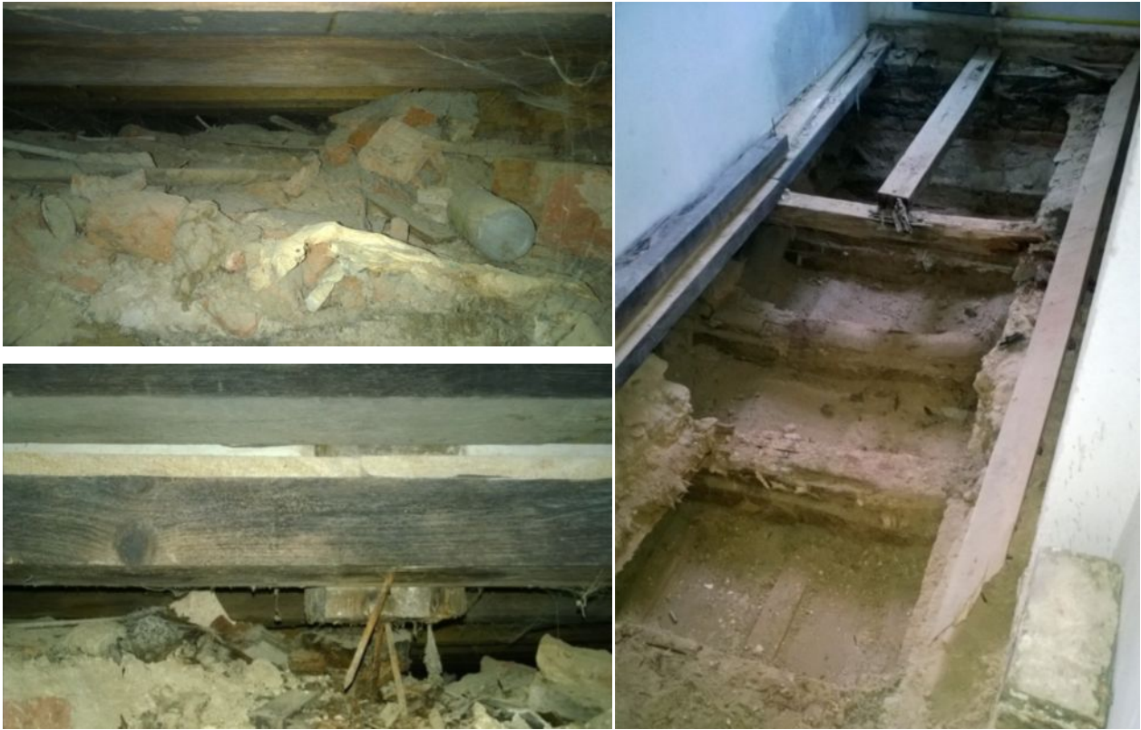
Foto sutě pod obývanou částí, celkové foto a foto nepodepřené sloupku krovu