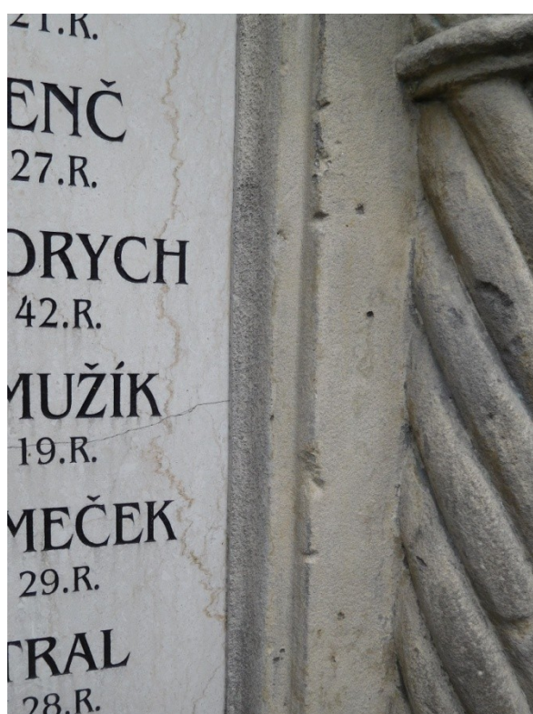
vegetace a drobná mechanická poškození