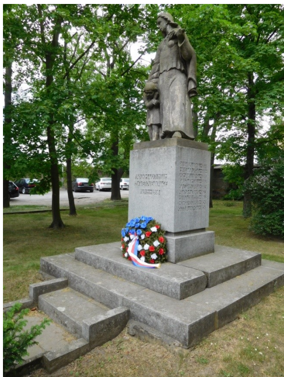
památník č. 1