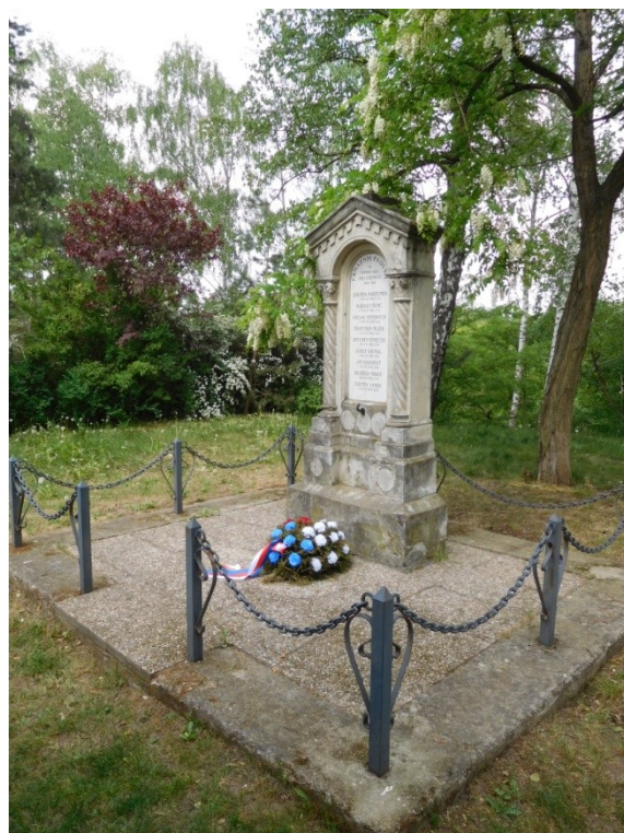
památník č. 2