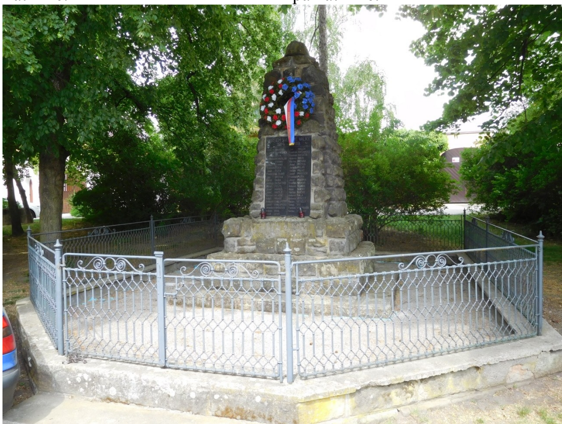
památník č. 3