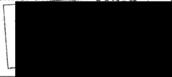
za zhotovitele Milan Oračko, jednatel