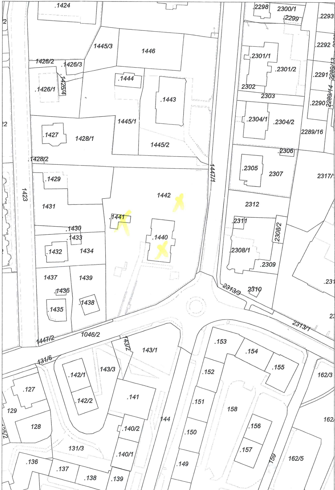
Mapa v měřítku 1:1207