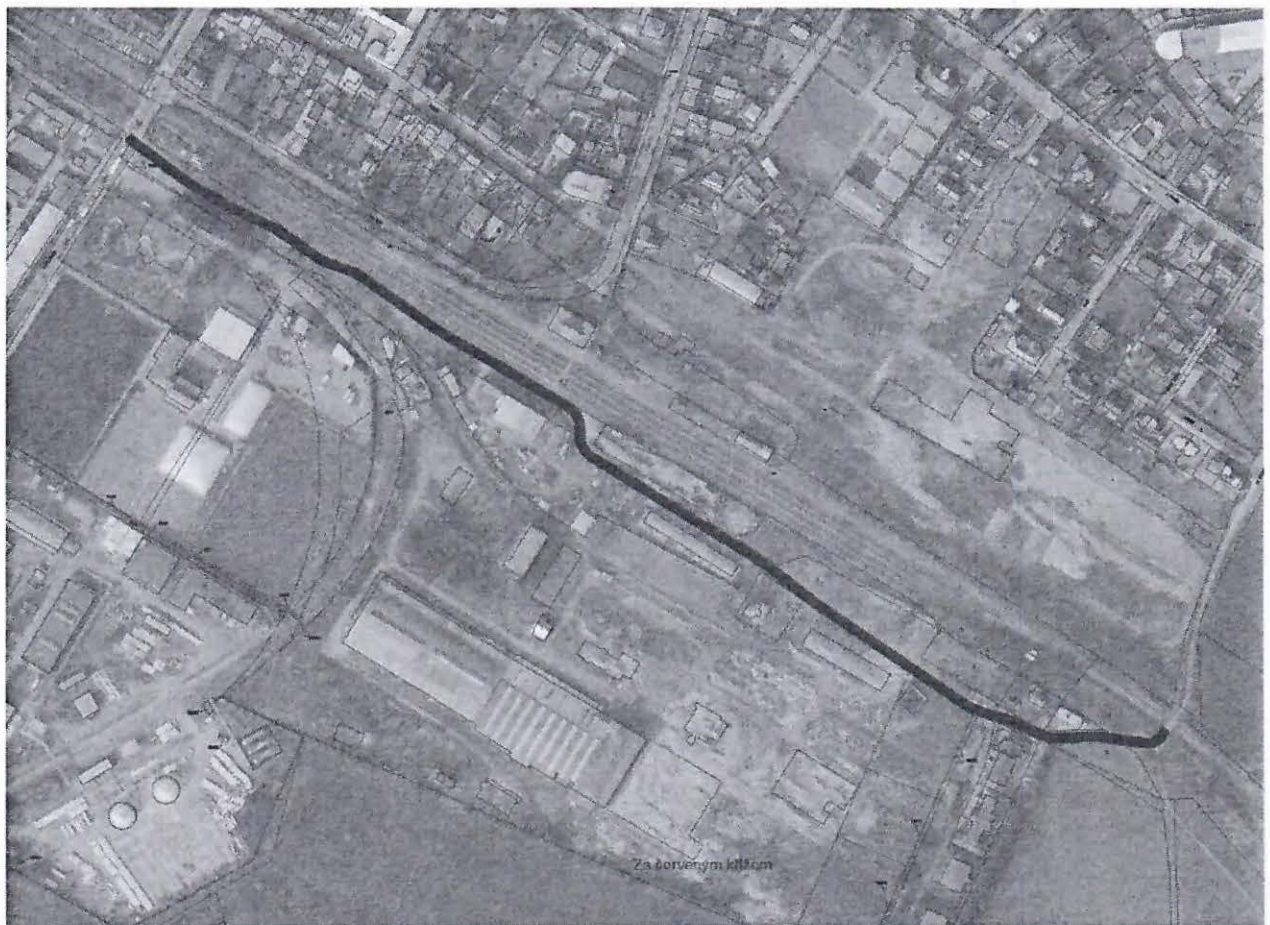
Zákres do snímku ortofoto mapy