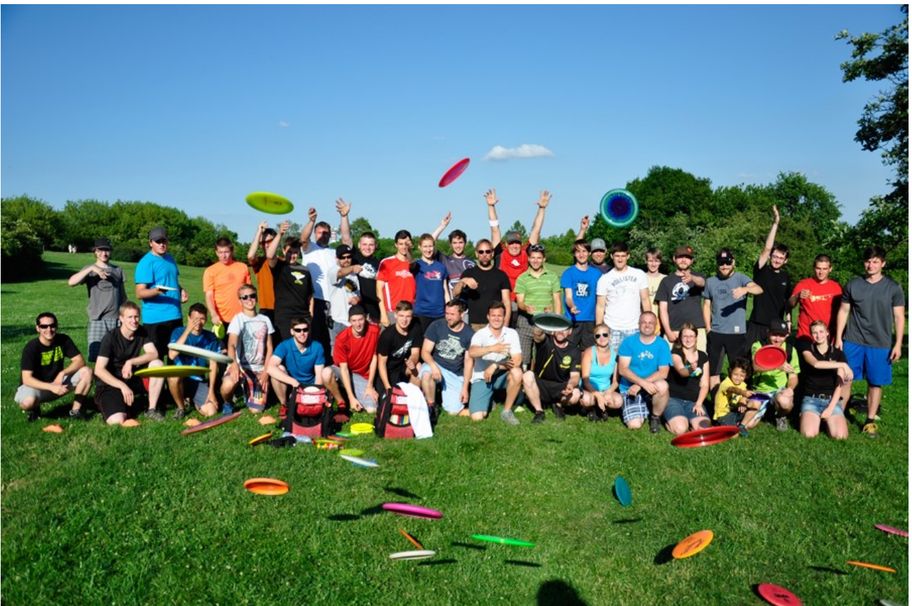
Skupinové foto účastníků discgolfové kliniky Deep in the Game, která proběhla 13. června 2014 v DiscGolfParku Ladronka