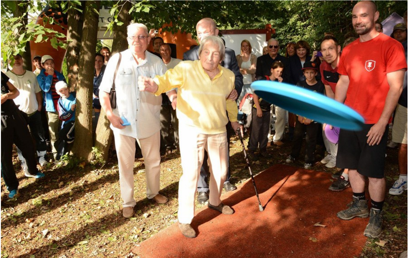
Olympionička Dana Zátopková slavnostně otevírá DiscGolfPark Kopřivnice, 18. 9. 2014

Discgolf je hra pro každého. A v tom je jeho největší krása a genialita!