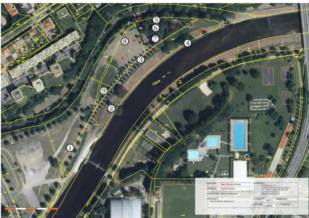
Návrh rozmístění jamek

Záruka: Záruka na veškerý mobiliář je 10 let. Záruka na neprozrazavění discgolfových košů je doživotní. Záruka kryjící vandalismus a zničení mobiliáře jsou 2 roky.