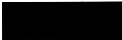
Jiří Tonžar prezident

LTC ČESKÉ BUDĚJOVICE, z.s. Vltavské nábř. 1, 370 05 Č. Budějovice IČO: 472 36 957 DIČ: CZ47236957 (1)