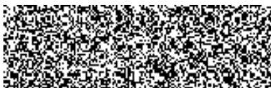
za prodávajícího Tomáš Hrdinka obchodní ředitel na základě plné moci