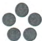
Tabulka č. 2