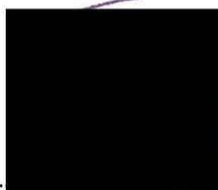
Ing. Jiří Švec starosta města Nepomuk

Vyvěšeno dne: - 5 -03- 2018 Sejmuto dne: ... 2.1...-03...2018