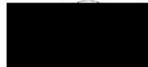
Mgr. Jiří Zemánek 1. náměstek hejtmána Olomouckého kraje