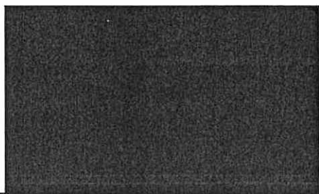
Ing. Jiří Klepsa starosta Města Jaroměř