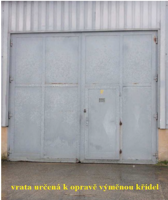
vrata určená k opravě výměnou křídel