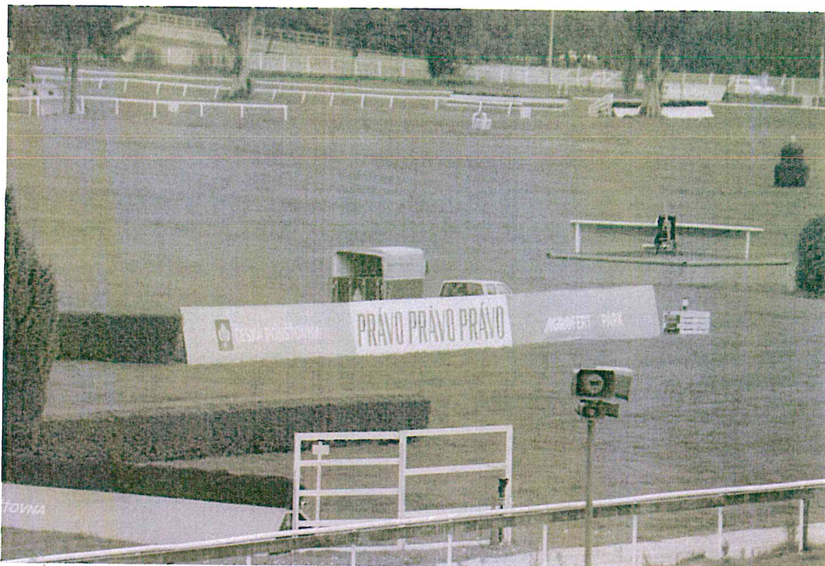
Velké pvc bannery na dráze: 2 ks pvc banner 920x154cm