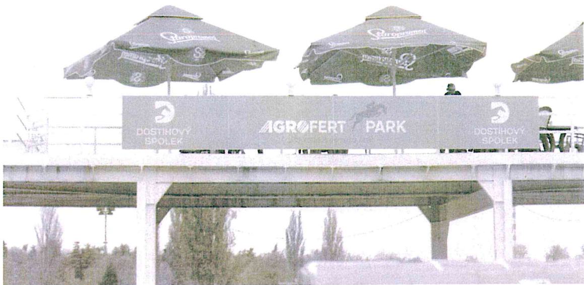
Tribuna u pískového kolbiště: 3 ks - dibond deska (síla 3mm) 300x109cm + polep