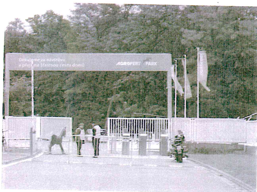
Vjezd deska na vrátech: dibond deska (síla 3mm) 244x127cm + polep - chybí

A small, stylized blue signature or mark located in the bottom right corner of the page.