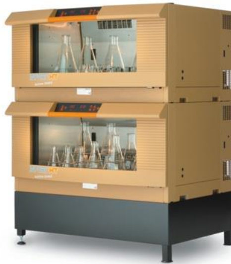
obrázek je ryze ilustrační

Díky tomu se Multitron Standard pohybuje v podstatně nižších cenových relacích oproti klasické verzi. Nižší cena ovšem není vykoupena na úkor pohodlné manipulace při nakládání/vykládání baněk, spolehlivosti třepání, chlazení/topení nebo životnosti. Multitron Standard zachovává spolehlivost a jednoduchost obsluhy jako dřívější, oblíbená verze Multitron 2. Vzhledově je lze rozeznat pouze díky nápisu Multitron Standard.