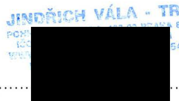
jméno a příjmení oprávněné osoby funkce, razítko