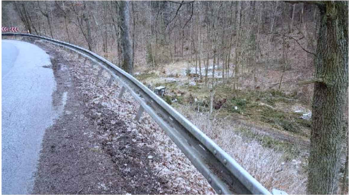
24.II/111 Český Šternberk-kř.III/11127 po pravé straně Výměna systému JSNH4/N2 2x50m ... 100m