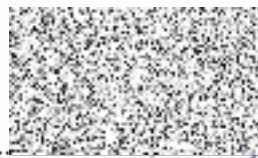
Ing. Miloš Petera náměstek hejtmanky pro oblast životního prostředí a zemědělství