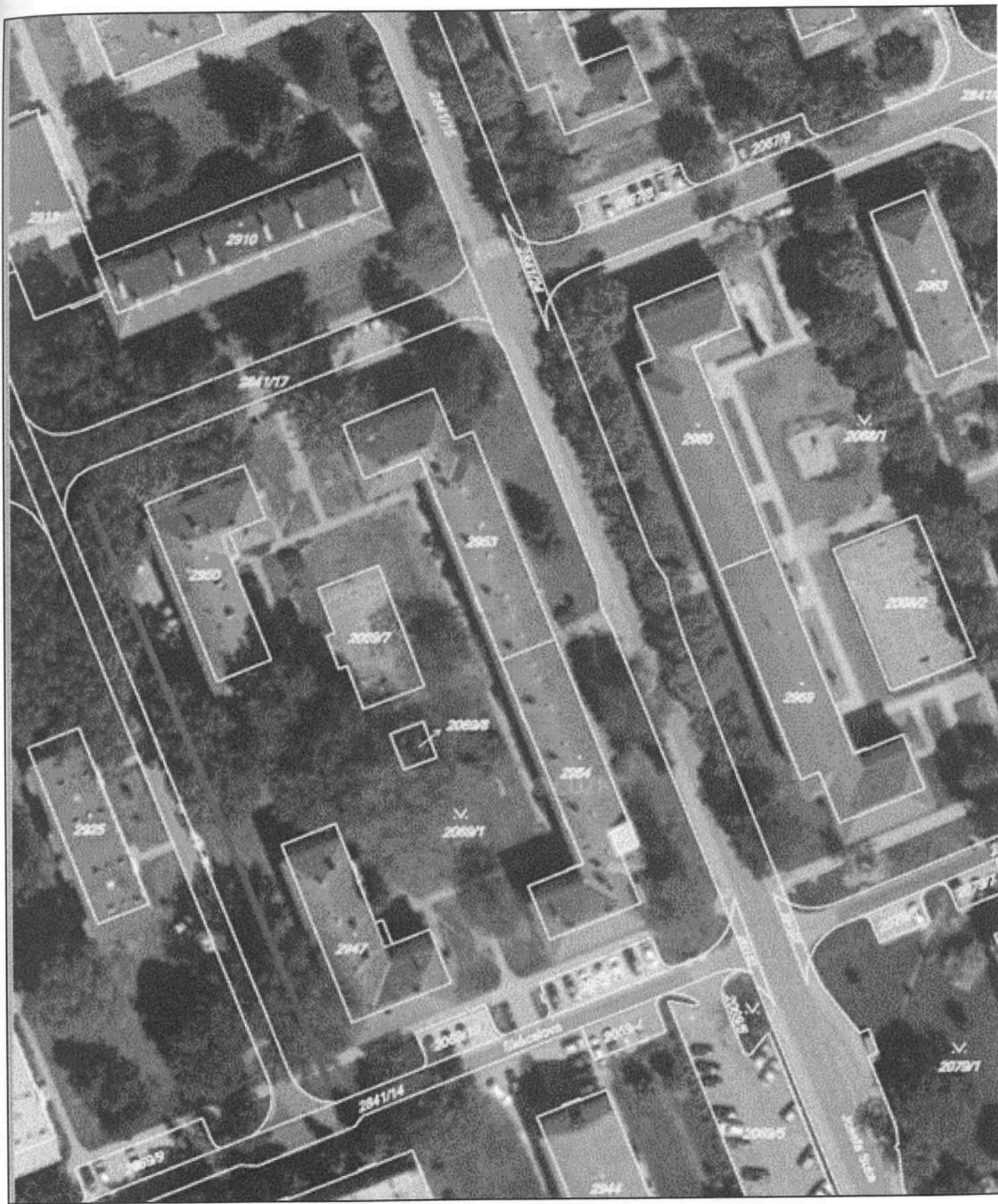
Příloha č. 25c