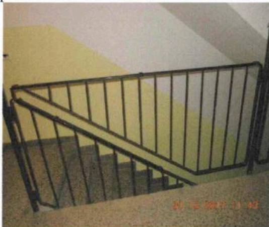
Obr. 1 příklad schodišťové zábradlí v BD interiér