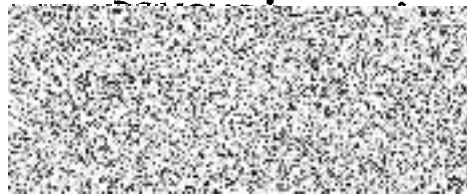
za Domov důchodců Čáslav nabyvatel