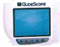
GlideScope Video Monitor (GVM3)