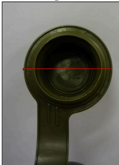
vzorová fotografie č. 6