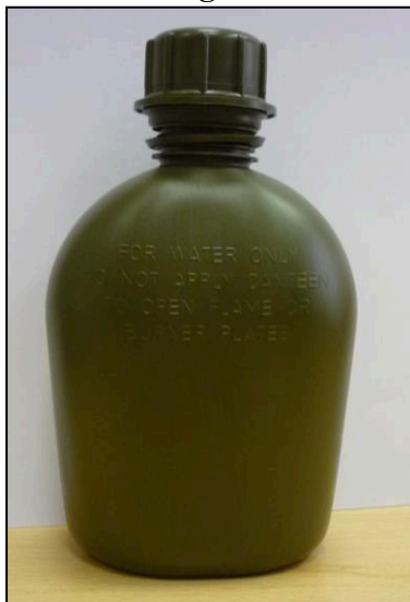
vzorová fotografie č. 3