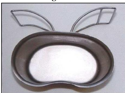
vzorová fotografie č. 7