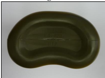
vzorová fotografie č. 5