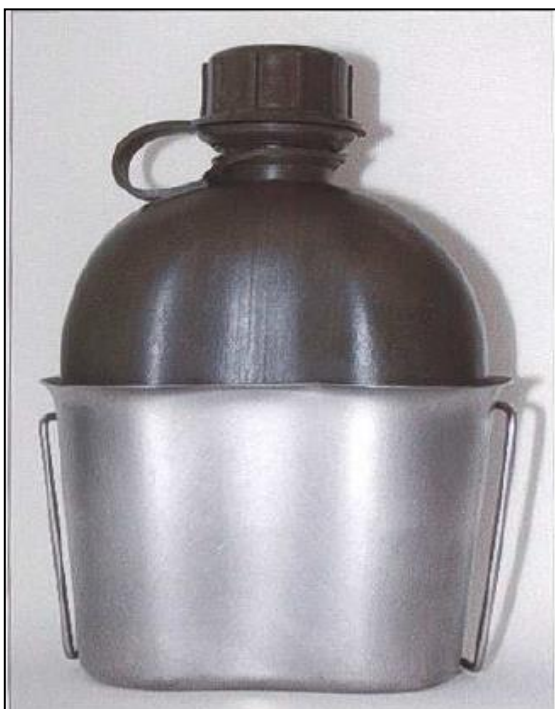
vzorová fotografie č. 1