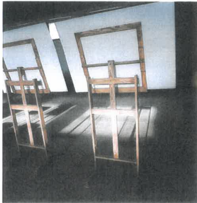
Detail stojánků zezadu