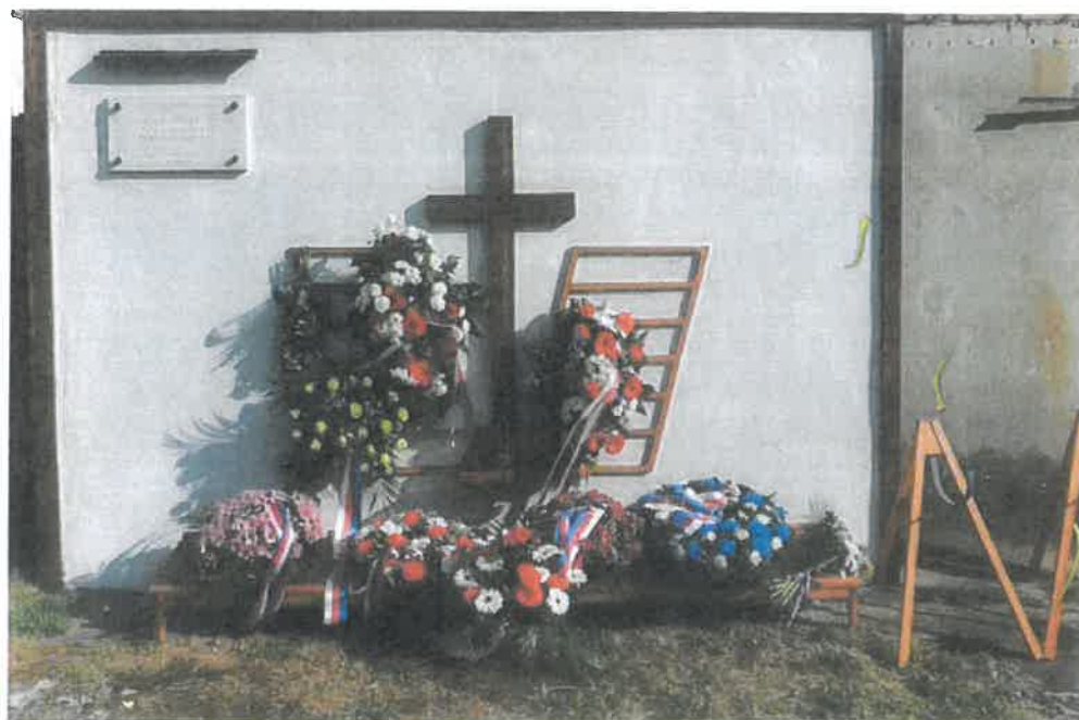
Pietní místo celkový pohled při akcích