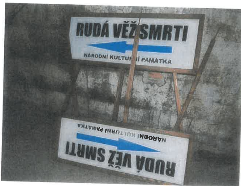
g) Přenosné směrovky dřevěné