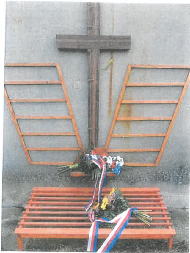
e) Přenosná dřevěná sestava (kříž a poličkou, dvě křídla na zavěšení věnců a lavičky na kytice)