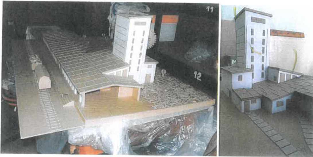
Dva detaily modelu – výrobek žáků SPŠ Loket