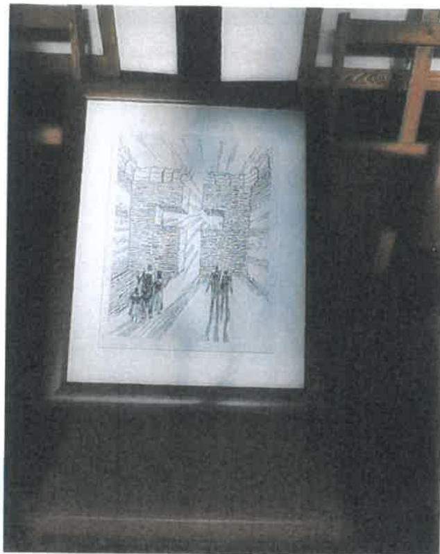
Obraz - perokresba