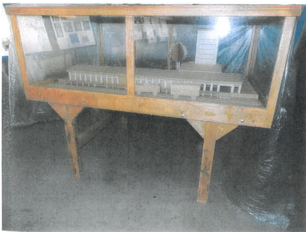
c) Zasklená skříň s kartonovým modelem NKP Rudá věž smrti (maketa)