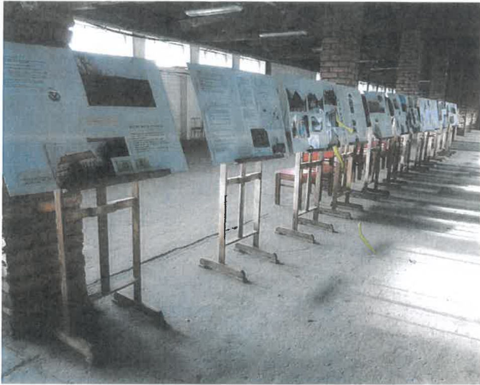
b) Stojany dřevěné 12 ks a 6 ks panelů