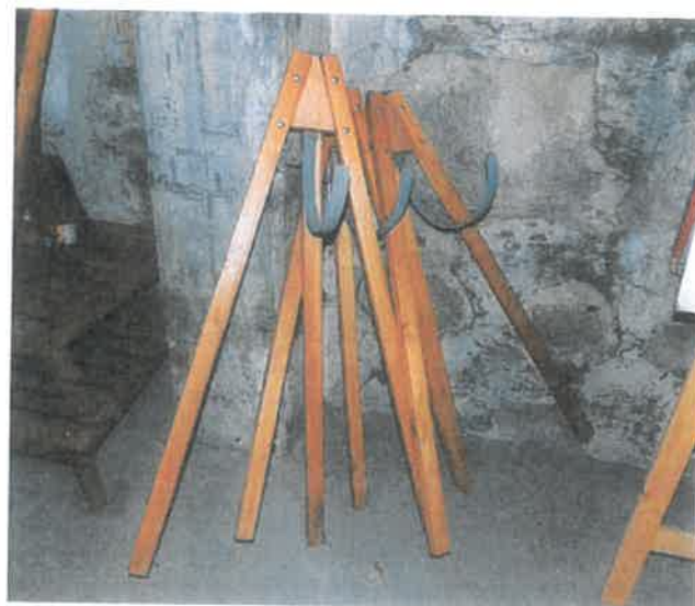
f) Tři stojánky na věnce