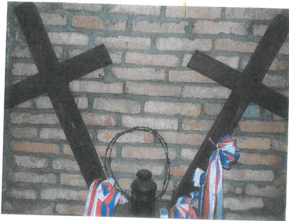
i) Dva pietní dřevěné kříže s poličkou uvnitř objektu