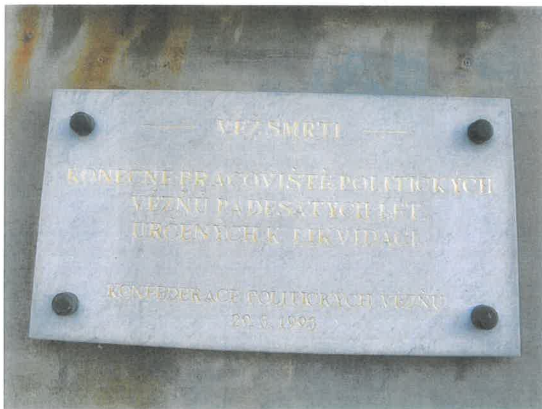
d) Detail Pamětní mramorová tabule