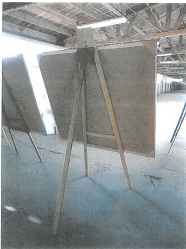
Dřevěné stojany (trojnožky) 11 kusů (mimo seznam, navíc)