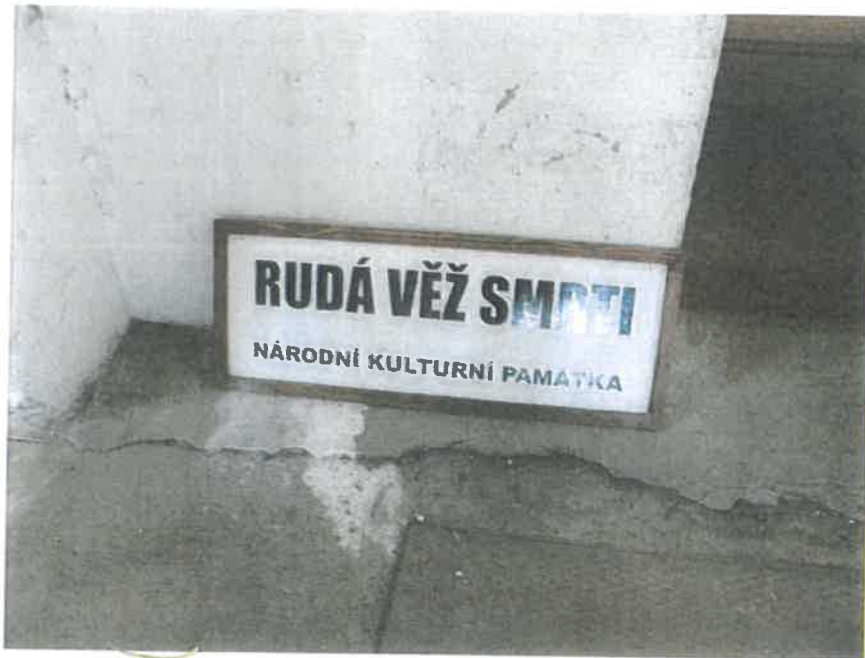
h) orientační tabule na budově věže, 2 ks