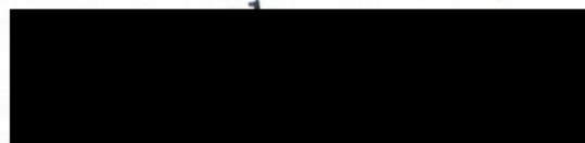
Za vysílající školu

ZÁKLADNÍ ŠKOLA PROFESORA ŠVEJCARA V PRAZE 12 PRAHA 4 - MODŘANY, MRÁČKOVA 3090/2