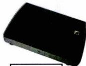
AUX 1 230V