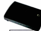
AUX 3 230V