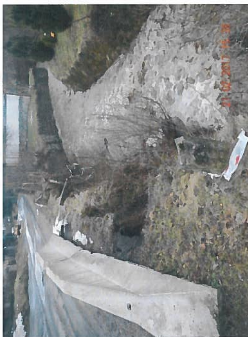
III/26219 Žandov, rekonstrukce nábrežních zdí